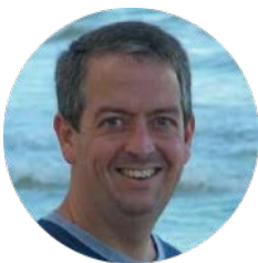
Kevin Thomas, Alabama (É.-U.) 'El Cenacle' vol.84.6 – © The Upper Room

Jésus dit à ses disciples: "Si quelqu'un veut venir après moi, qu'il renonce à lui-même, qu'il se charge de sa croix, et qu'il me suive."